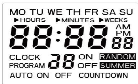
rys. 1 Wyświetlacz LCD